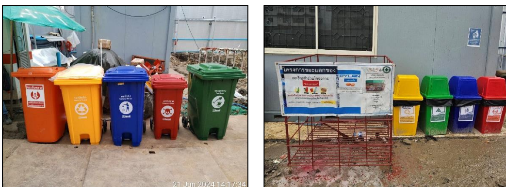
รูปที่ 1-8 ถังขยะภายในโครงการ

มูลฝอยเกิดจากขยะในกิจกรรมประจำวันของคนงาน เช่น พลาสติก เศษอาหาร เป็นต้น ซึ่งได้มีการจัดให้มีการแยกประเภทถังขยะ โดยการติดป้ายแต่ละประเภทอย่างชัดเจน (ดังแสดงในรูป 1-8) อีกทั้งยังได้มีการประสานงานกับสำนักงานเขตวัฒนามารับมูลฝอยไปกำจัดต่อไป ทั้งนี้ โครงการได้รับหนังสือรับรองการให้บริการจัดเก็บขยะมูลฝอย สิ่งปฏิกูล และกากไขมัน ให้กับโครงการจากสำนักงานเขตวัฒนา ที่ กท 6506/2646 ลงวันที่ 13 มิถุนายน 2565 เรียบร้อยแล้ว ดังแสดงในภาคผนวก ข-3