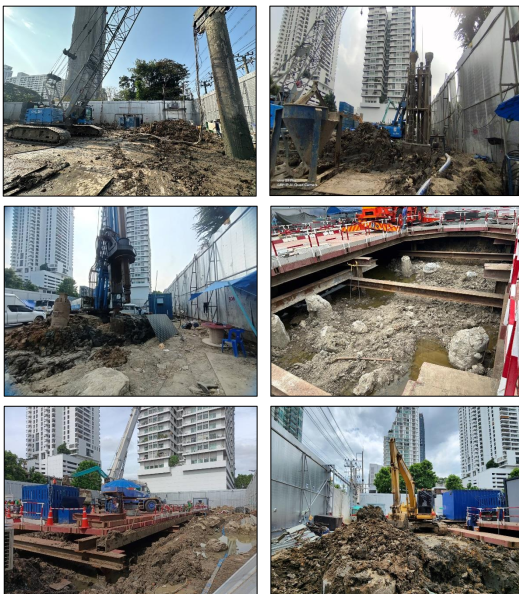
รูปที่ 1-4 สภาพปัจจุบันของโครงการ

โครงการได้รับหนังสืออนุญาต ใบรับแจ้งการก่อสร้าง คัดแปลง หรือรื้อถอนอาคาร ตามมาตรา 39 ตรี เลขที่ 144/2566 ออกให้ ณ วันที่ 27 กันยายน 2566 (ฉบับแก้ไข) บังคับใช้ วันที่ 22 มกราคม พ.ศ. 2567 ดังแสดงในภาคผนวก ก-2 เรียบร้อยแล้ว โครงการได้ดำเนินการ ช่วงงานเจาะ ลงเสาเข็ม ในช่วงเดือนมกราคม - พฤษภาคม พ.ศ. 2567 โดยบริษัท ไพลอน จำกัด (มหาชน) เสร็จเรียบร้อยแล้ว และในเดือนมิถุนายนเป็นงานขุดดินฐานรากโครงสร้างอาคาร โดยบริษัท บวิก - ไทย จำกัด ดังแสดงในรูปที่ 1-4