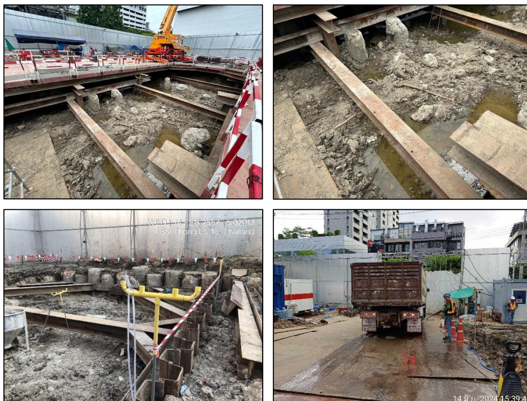
รูปที่ 1-5 พื้นที่ภายในโครงการ

ปัจจุบันโครงการมีการใช้น้ำในกิจกรรมทั่วไป ซึ่งยังไม่มีการวางท่อระบายน้ำ กิจกรรมภายในโครงการมีการใช้น้ำในปริมาณน้อย จึงเป็นการปล่อยน้ำซึมลงพื้นดิน ดังแสดงในรูปที่ 1-5