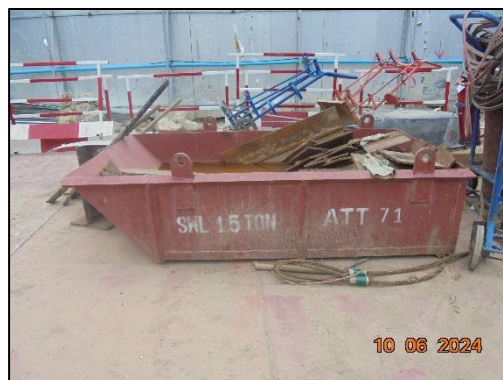
รูปที่ 1-7 ภาชนะรองรับเศษวัสดุก่อสร้าง