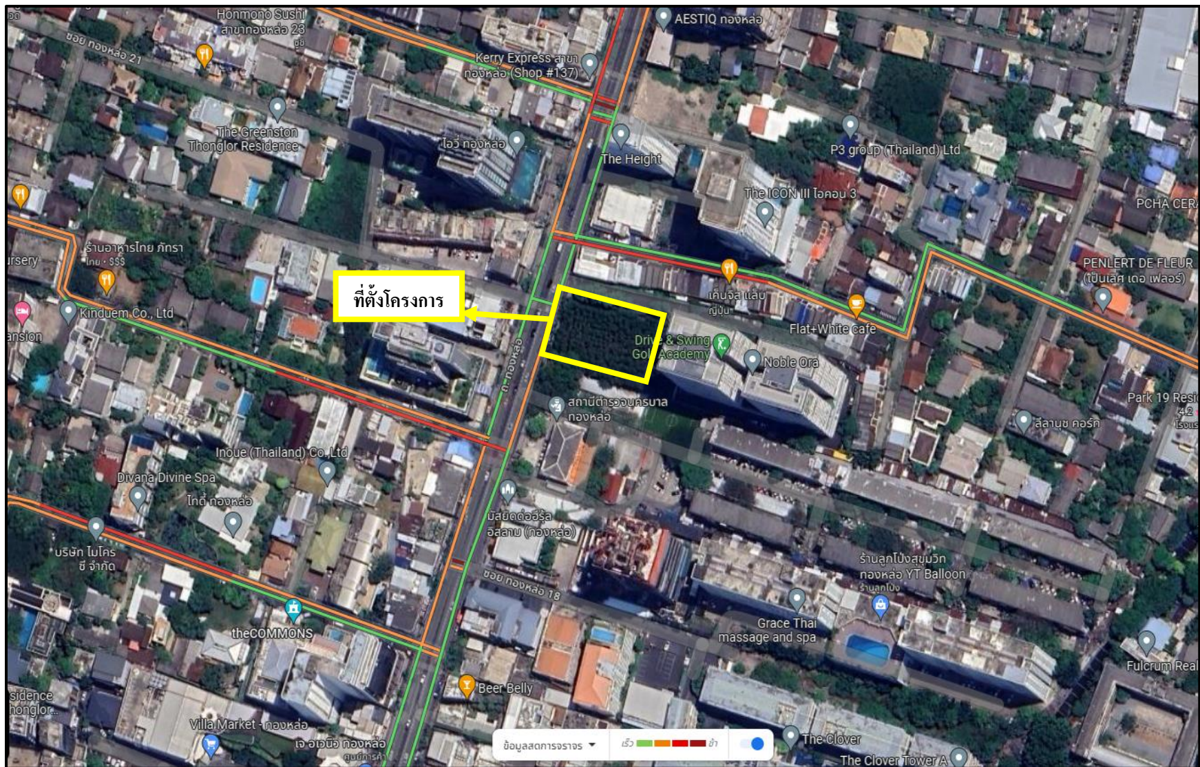
รูปที่ 1-1 แผนที่แสดงที่ตั้งโครงการ