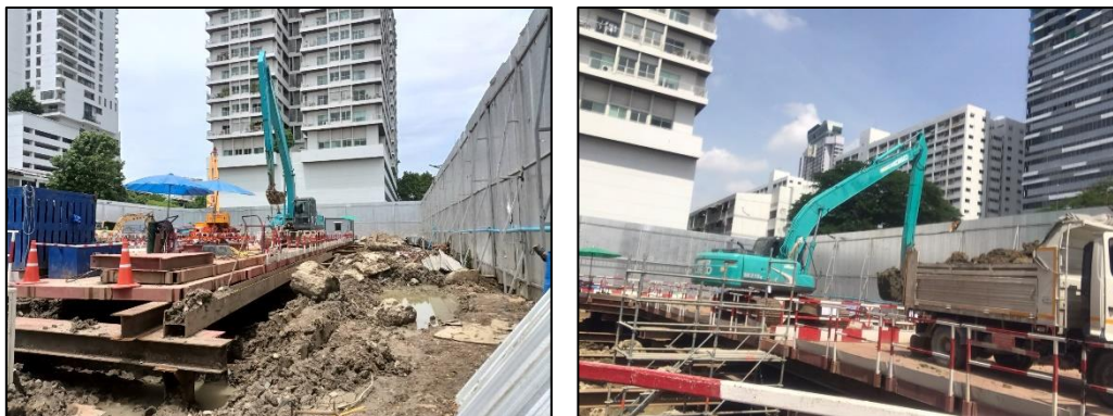
รูปที่ 1-6 ขุดดินในพื้นที่โครงการ

ปัจจุบันโครงการอยู่ในระยะก่อสร้าง ช่วงขุดดินก่อสร้างชั้นใต้ดิน ยังไม่มีเศษวัสดุที่เกิดจากการก่อสร้างมีเพียงการขุดดินออกนอกพื้นที่โครงการ ทั้งนี้โครงการมีการจัดเตรียมภาชนะไว้รองรับเศษวัสดุก่อสร้างในพื้นที่โครงการเรียบร้อยแล้ว ดังแสดงในรูปที่ 1-6 และรูปที่ 1-7