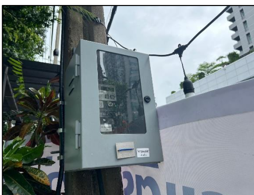
รูปที่ 1-9 มิเตอร์ไฟฟ้าก่อสร้างโครงการ

พื้นที่โครงการอยู่ในเขตความรับผิดชอบของการไฟฟ้านครหลวง (กฟน.) เขตบางกะปิ โดยมีการติดตั้งมิเตอร์ไฟฟ้าเฉพาะการก่อสร้างไว้บริเวณด้านหน้าโครงการ (ดังแสดงในรูป 1-9) อีกทั้งได้รับหนังสือยืนยันความพร้อมในการจ่ายกระแสไฟฟ้าให้กับโครงการที่ มท 5276/21.00111/65 ลงวันที่ 7 มิถุนายน 2565 ดังแสดงในภาคผนวก ข-4